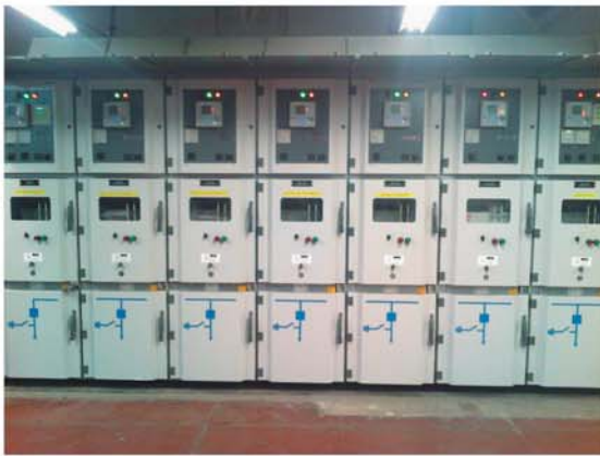
Sala de Máquinas Alimentadores de media tensión