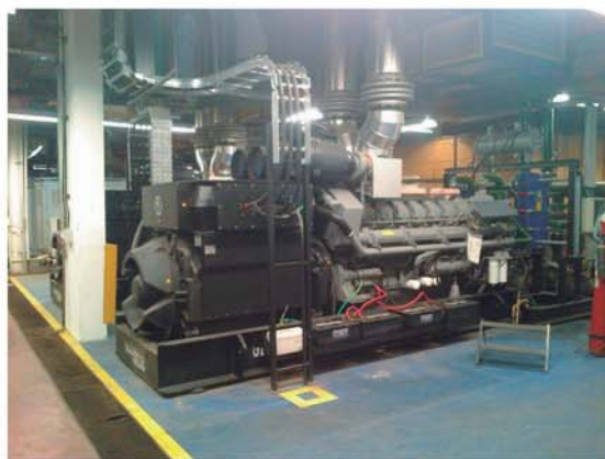
Instalación Generador eléctrico